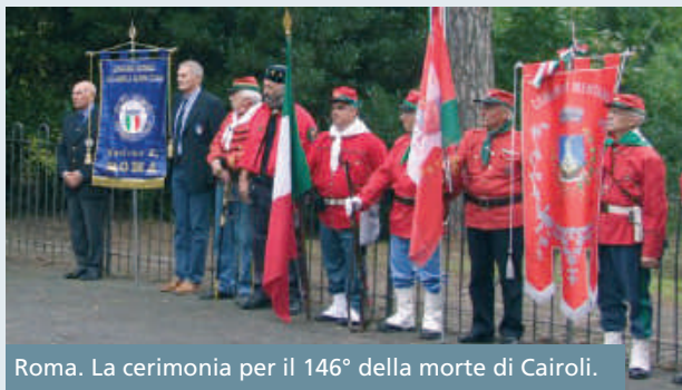
Roma. La cerimonia per il 146° della morte di Cairoli.