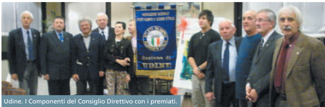
Udine. I Componenti del Consiglio Direttivo con i premiati.

Per quanto riguarda l'attività sportiva dirigenziale,