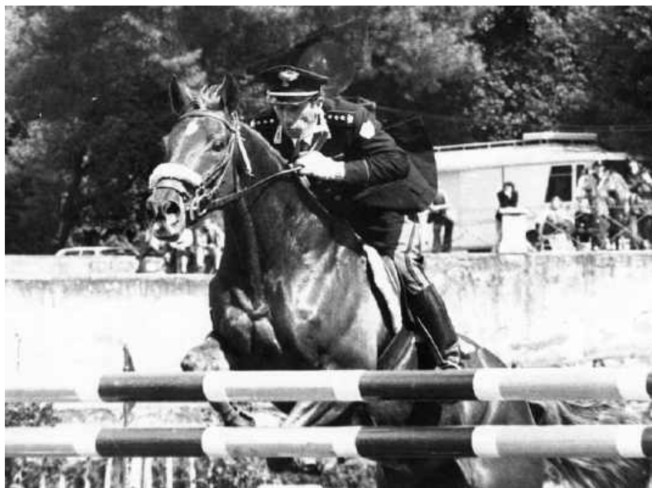
Nella pagina a fianco e a destra, due immagini di Piero a cavallo e in gara.

ALESSIO LIBERATI Magistrato e Pres. Ass. Magistrati Italiani pubblicato in data 14-02-2014 su www.ilfattoquotidiano.it